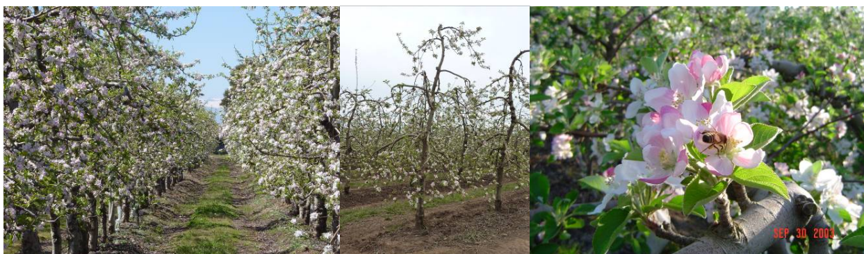
Foto 1. Manzanos con una muy buena y pareja floración (izquierda) y un árbol con floración muy diferida (centro). Abeja polinizando una flor de manzano (derecha).